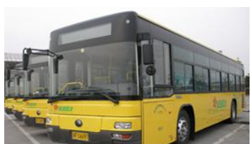
ZigBee 智能公交通讯系统