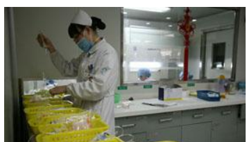
智能药篮子解决方案