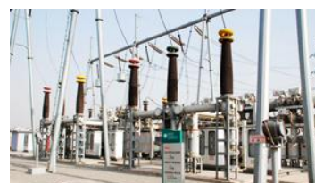
变电站无人值守监控