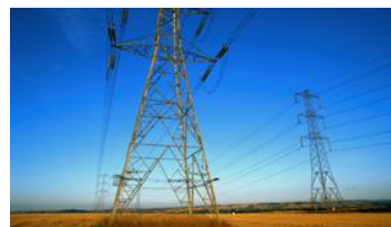
ZigBee 5 公里远距离传输方案