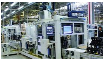
智能制造监控系统