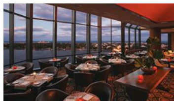
餐厅人员定位系统